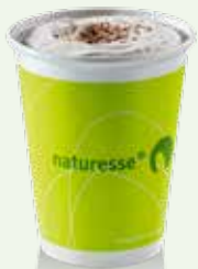
Zellulose / PLA